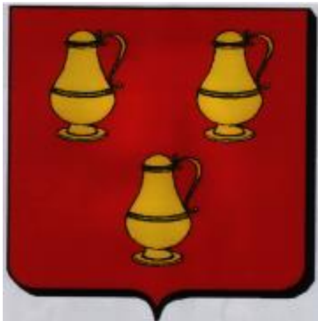
"In de vergulde Kan" (?)