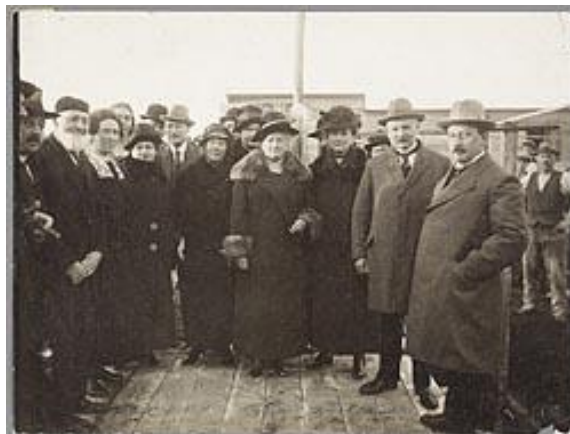
K.Kan Kzn, vooraan tweede van rechts (1924).

Dan in 1941 komt er een geduchte tegenslag als het op uitdrukkelijk medisch advies noodig blijkt om vele dingen te laten varen en om wat rustiger te gaan leven.