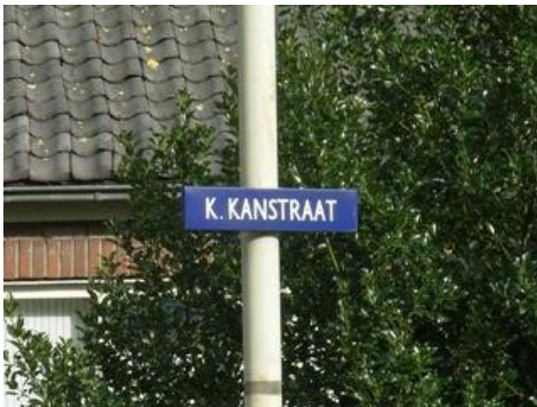
De Klaas Kanstraat in het centrum van Zaandam.