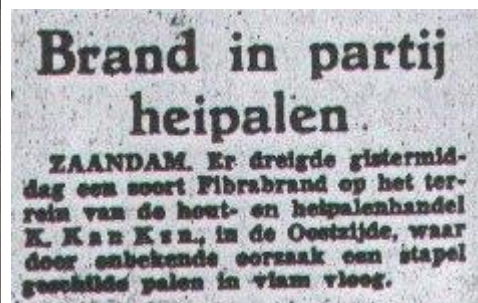
Deze foto werd genomen op de palenwerf op 2 juli 1952. Er woedde toen brand in de stapels heipalen. (Zie links de brandweerman met slang)