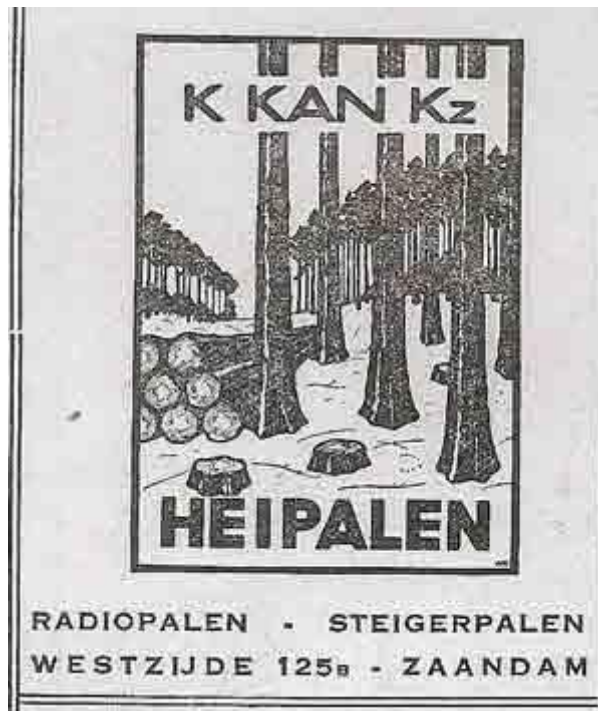
Advertentie uit het blad de Standaard (1933)

Bij deze stand van zaken was het, dat onze jongste zoon Willem, die al eenige jaren in het bedrijf meewerkte, zoo langzaam aan een deel van de leiding der zaken overnam. Het mag een voordeel zijn als jonge krachten kunnen worden ingeschakeld, die met jeugdige idealisme aan de opbouw van wat bestaat kunnen meewerken. Vooral in de oorlogsjaren met haar vele voorschriften en verordeningen, waarbij alles wat jaren in vrijheid had geleefd, aan banden werd gelegd, was het voor oudere zakenmensen niet zoo gemakkelijk om zich bij dit alles aan te passen. Er waren veel moeilijkheden te overwinnen maar de jeugdige energie van mijn zoon ging voor niets opzij en zoo kon er verkocht worden tot op de tijd toen op alle dennehout in Nederland beslag gelegd werd.