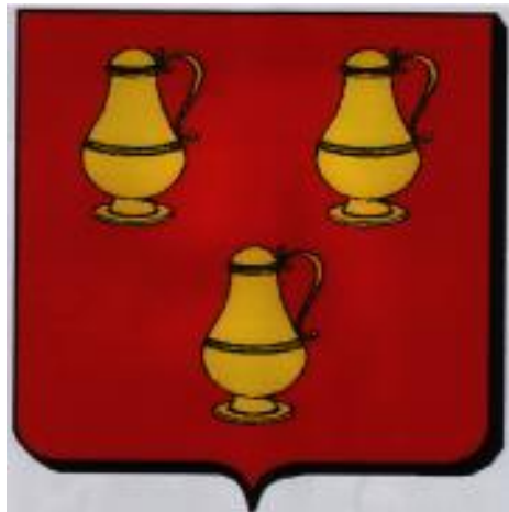
"In de vergulde Kan" (?)