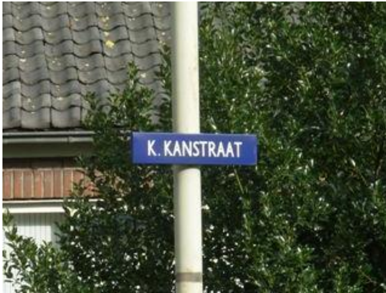
De Klaas Kanstraat in het centrum van Zaandam.