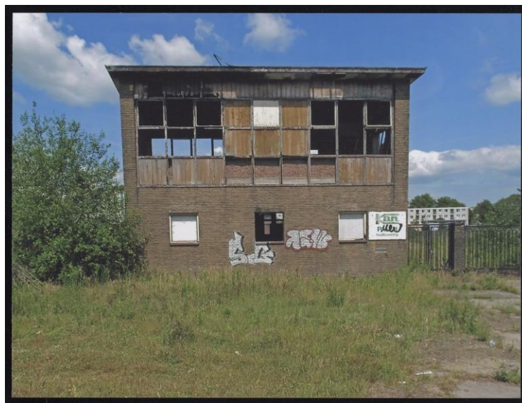
Voormalig gebouw van de heipalenfirma in 2011